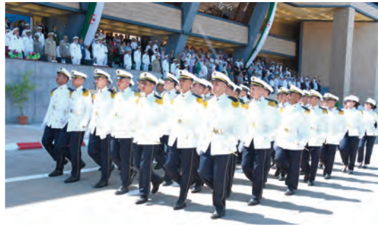
المهنية الملقنة من أجل تعزيز أخلاق المهنة وكذا مواصلة التحضير البدني والتقني لمكافحة كل أنواع الإرهاب الحديث بكل أشكاله مع الأخذ بعين الاعتبار الجرائم

أشرف قائد القوات البحرية اللواء بن مداح محفوظ، على مراسم تخرج دفعات جديدة بالمدرسة العليا للبحرية "المرحوم المجاهد اللواء محمد بوتيفان" بتامنغوست (الجزائر العاصمة).