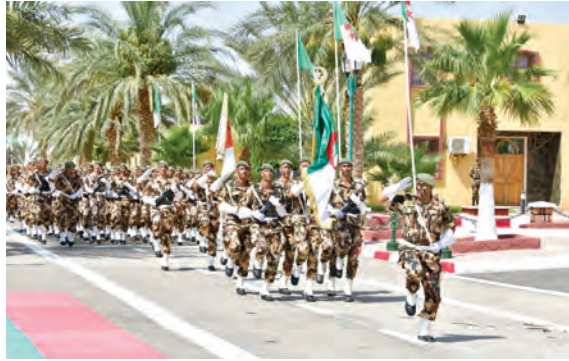
التكويينة لا تكتمل إلا بنجاح خريجيه وانضباطهم واستمرار المعارف العسكرية التي تلقوها في مساهمة المهني للدفاع عن الوطن. وقد قدم أفراد وفصائل من القوات الخاصة

استهل قائد الناحية العسكرية الرابعة هذه المراسم بتفتيش مريمات الدفاتر الممتلئة بالملابس المتخفية وأداء مراسم القسم وتكريم المتوفين وتقليد الرتب وتسليم واستلام العلم وتسمية الدفاتر باسم المجاهد المتوفي محمود ناصري والأطلاح على مختلف النشاطات التعليمية والثقافية والرياضية التي جرت خلال السنة التكوينية 2024-2025.