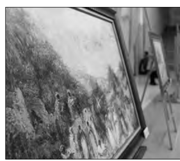
بلجيكا بمناسبة شهر التراث (18 أبريل-18 ماي). ويحضور عدد من ممثلي

وزير الثقافة والفنون زهير بللو أن "هذا المعرض الوطني الاستثنائي الذي يحتفي بجزء من الذاكرة المشتركة بين الجزائر وملكة بلجيكا" هو "تتويج لمسار تعاوني وحق استثنائي بين البلدين". وفي صرح سفير ملكة بلجيكا لدى الجزائر يقول "تكرم من خلال هذه المبادرة رجلا يمسك مساره الشخصي والفني، ثراء الحوار بين بلدينا". ويقدم المعرض لوحات تعكس الجرائز، وتوجد لوحات وصور بوغالي بأن "الجزائر ألهمت العديد من الفنانين التشكيليين الأجانب المشهورين دوليا على غرار بابلو بيكاسو وإتيان نصر الدين سبيلانت وادوارد فيرشافيلت". من جهته، اعتبر