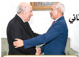
استقبل وزير الدفاع الموريتاني الفريق أول شنقرية:

العلاقات الجزائرية-الموريتانية نموذج يجتذبي به عربيا وإفريقيا