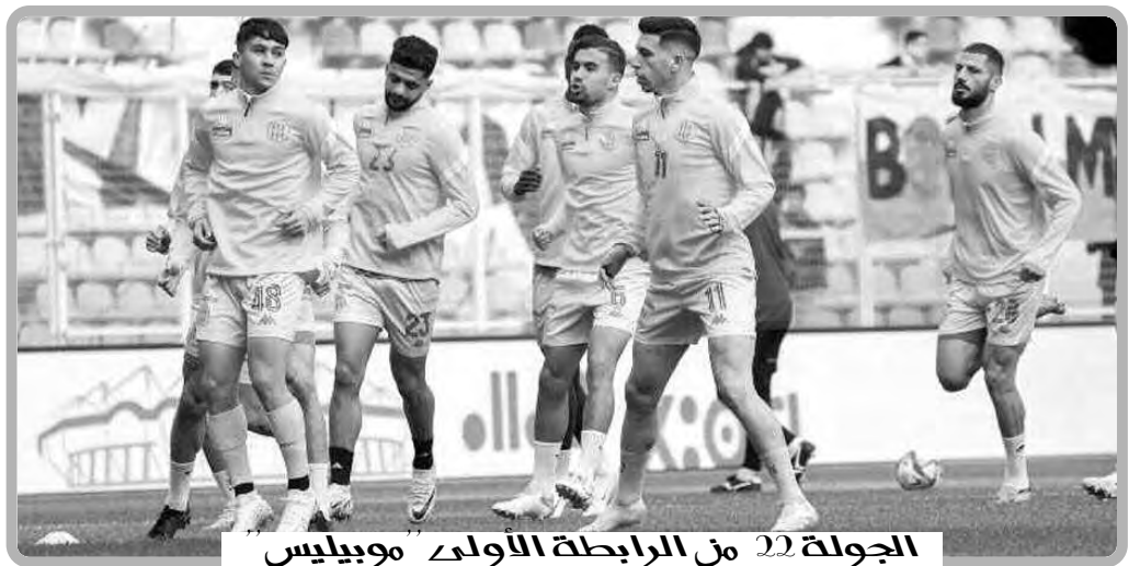
ال الجولة 22 من الرابطة الأولى موبيليس

وفي سياق متصل، أشارت هيئة ياسين سيليني إلى أن الأهداف التي تشكل أولى أولويات الاتحادية خلال العهدة الأولمبية 2025، تتمثل في تحقيق أفضل النتائج على كل الأصعدة؛ بسيطرة الجيدو الجزائري على الميداليات الذهبية في مختلف الأوزان، خاصة من الأقسام الشابة التي تُعد خزان المنتخب الوطني الأول، قصد دخول البساط الدولي؛ على غرار منازلات الغراند سلام، وبطولة العالم التي ستكون بداية من شهر ماي القادم، في أحسن جاهزية.