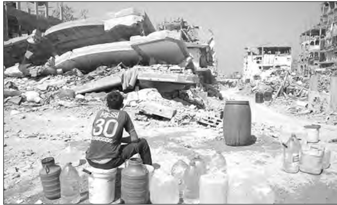
استشهد 11 فلسطينيا في غارات صهيونية

استشهد 11 فلسطينيا فيما أصيب عدد آخر بجروح مختلفة في سلسلة غارات جوية صهيونية فجر أمس، استهدفت مناطق متفرقة من قطاع غزة. وأفادت وزارة الصحة الفلسطينية، باستشهد 11 فلسطينيا بينهم خمسة أطفال في قصف صهيوني على منازل وتجمعات للفلسطينيين في مخيم البريج وجباليا ومدينتي غزة وكان يونس، وفي الضفة الغربية أصيب طفل برصاص الاحتلال الصهيوني في مخيم الفوار جنوب مدينة الخليل، تراقف ذلك مع اقتحام قوات الاحتلال لعدد من المدن والبلدات الفلسطينية ومدهامة منازل الفلسطينيين والاعتداء على سكانها.