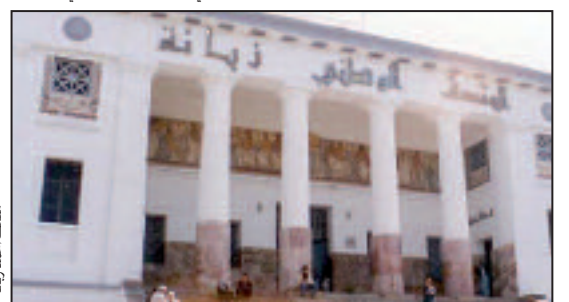
الصالون الوطني للفنون التشكيلية

يُتوقع حضور زهاء 80 فناناً تشكيلياً ضمن فعاليات الطبعة الرابعة للصالون الوطني للفنون التشكيلية، الذي ستحتضنه ولاية وهران بداية من الفاتح نوفمبر المقبل بالمتحف الوطني "أحمد زيانا" تحت شعار "توفير الحرية"، من بينهم 30 فناناً من مختلف ولايات القطر، واليهابون من