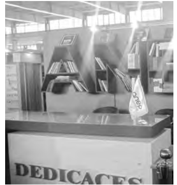
"أنا"، "القصبة" و"الشهاب" بين الرغبة في التجديد وتأكيد نجاعة التقليد