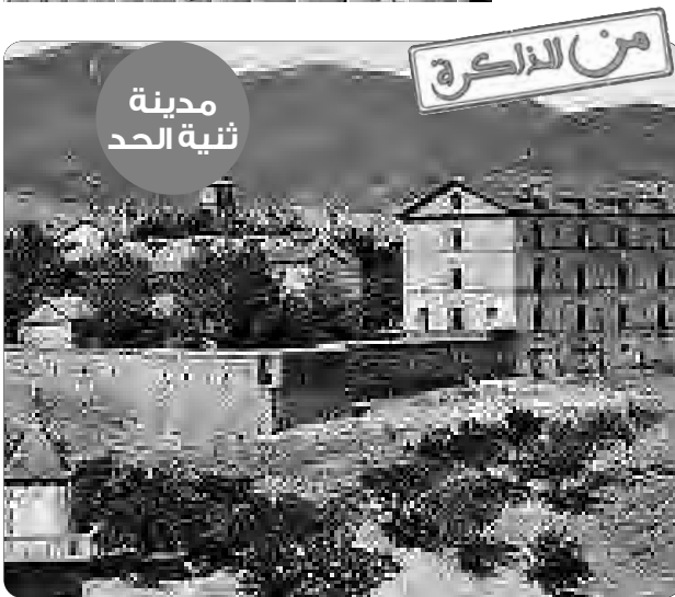
مدينة ثنية الحد

أطلقت الخطوط الجوية الجزائرية عروضاً ترويجية لخمس خطوط دولية، بما في ذلك ثلاثة خطوط فرنسية، وتقدم شركة الخطوط الجوية الجزائرية أسعاراً ترويجية عند اقتناء التذاكر لثلاث وجهات مع فرنسا، واحدة إلى مصر، وأخرى إلى تركيا. وسيكون آخر أجل لموعد الحجز يوم 30 نوفمبر، وفيما يتعلق بفترة السفر، فإنها ستمتد حتى 31 ماي 2025.