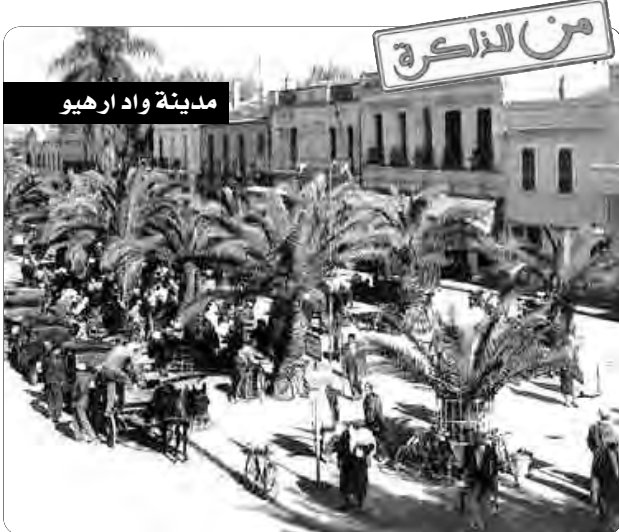
مدينة واد اريهو

تنظم وزارة الصيد البحري والمنتجات الصيدية، يومي 23 و 24 أكتوبر الجاري، بالتنسيق مع الهيئة العامة لمصايد أسماك البحر الأبيض المتوسط (CGPM) التابعة لمنظمة الأغذية والزراعة "فاو"، ورشة تكوينية لفائدة إطارات الوزارة حول تسيير مناطق تربية المائيات البحرية. وأوضح بيان للوزارة أن الورشة التي تنظم بمقر مديرية الصيد البحري وتربية المائيات لولاية الجزائر بعين البنيان، تجري تحت تاثير خبرة دولية تابعة للهيئة العامة لمصايد أسماك البحر الأبيض المتوسط.