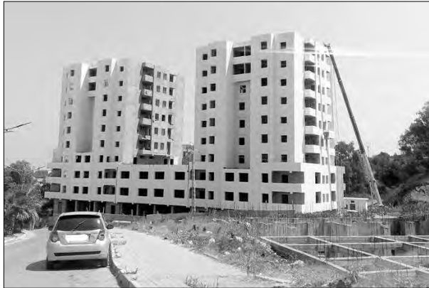
تاريخ تسليم هذا المشروع، ما يوحي بتأخيره إلى أجل غير معلوم، وهو ما جعلهم يناشدون الوالي للتدخل شخصيا في القريب العاجل؛ لإنصاف المكتبين الذين ينتظرون سكناتهم منذ 2015.