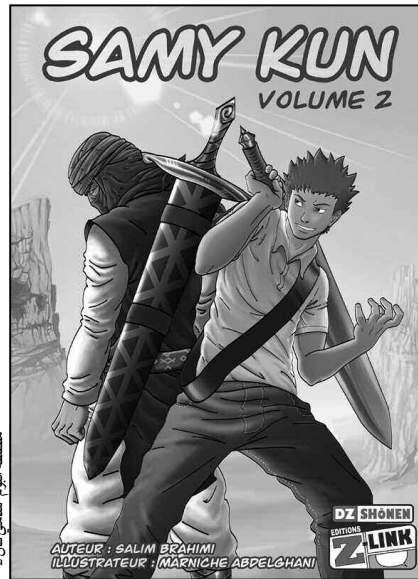
ملصقة ألبوم "سامي كان 2" من إصدار "Z LINK"

تشارك دار "زاد لينك" المتخصصة في نشر المانغا، في فعاليات الطبعة الجديدة للمهرجان الدولي للشرطير المرسوم الذي ينطلق بعد غد وتتواصل فعالياته إلى غاية 27 من الشهر الجاري. بخمسة ألبومات خاصة بفترة الشباب. "سامي كان 2"، "سينوس زيرو 1"، "غدا إن شاء الله"، "قويدر، النسخة العربية"، و"قويدر النسخة الفرنسية" والعدد الجديد لمجلة "لاستور"، هي العناوين التي تدخل بها دار "زاد لينك" غمار "فيديا 2014".