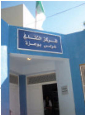
المدخل إلى المركز الثقافي "غراس بوعزة" بولاية وهران

كما ينظم هذا المركز أيضاً، نشاطات ثقافية أدبية على غرار الأمسيات الأدبية وملتقى الشعراء الشباب الذي يرفع الراي الأدبي التابع له، والمهرجان السنوي الخاص بالشباب، بالمقابل ينسّق المركز الثقافي "غراس بوعزة"، نشاطاته من مديرية الشباب والرياضة بولاية وهران، التي