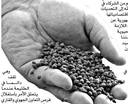
وهي تتدفق دائماً في الطليعة عندما يتعلق الأمر باستغلال فرص التعاون الجهوي والقاري وتعزيزه.

الحد من لجوء المزارعين الصغار الذين يمثلون أغلبية المنتجين في القارة إلى الأسمدة الضرورية لتخصيب التربة. وأكد بأن الجزائر "تولي كل العناية لفرص تقاسم الخبرة والتجربة، وتعزيز التعاون القاري في شتى المجالات، للمعاسي المتعلقة بالتنمية في إفريقيا، خاصة تلك المرتبطة بالأمن الغذائي، وهي تشاطر في هذه المناسبة استغلال الدول الإفريقية بضرورة توفير الأسمدة لإنتاج احتياجاتها الغذائية، ومعالجة تدهور صحة التربة، بفعل التغيرات المناخية الحادة، والممارسات ذات الصلة بالغالب البشري المضرب بالزراعة والبيئة والثروات الطبيعية الأخرى. وشدد على أن الجزائر الحريصة على الوفاء الدائم لالتزاماتها الإفريقية، تتجسد في استمرارها من خلال الانخراط في كل الجهود الجماعية التي من شأنها تحقيق تطلعاتنا إلى إفريقيا مزدهرة، وخالية من الهشاشة والفقر، ومن آثار الظلم الاستعماري الذي عانت منه شعوب قارتنا،