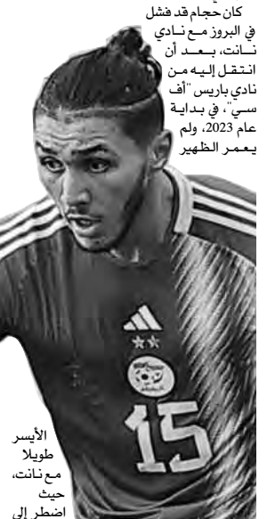
الأسير طويلا مع نانت، حيث اضطر إلى

يجدر الذكر، أن جوان حجام يجد منافسة كبيرة في منصب الظهير الأيسر في المنتخب الوطني، بتواجد ريان نوري نجم ولفرهامبتون الإنجليزي، المتألق بدوره بشكل لافت في "البريميرليغ".