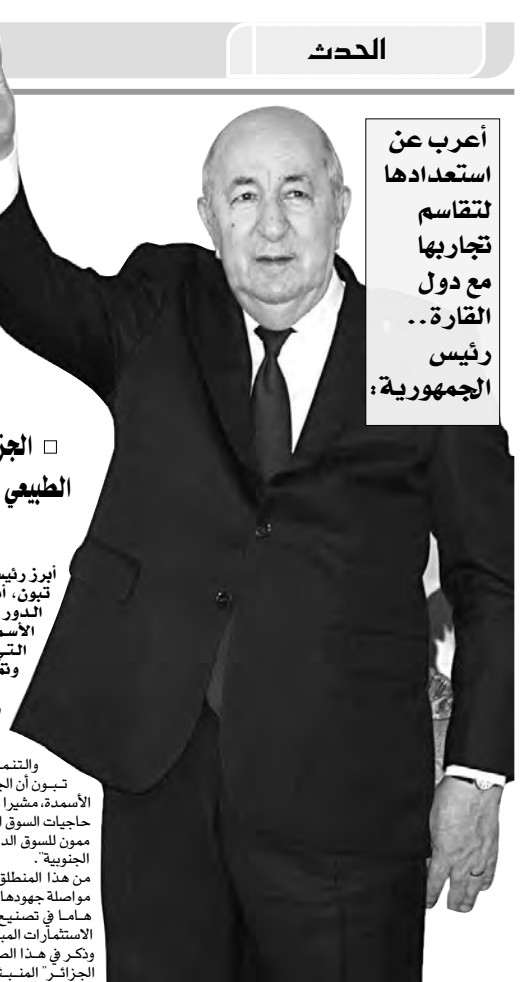
أعرب عن استعدادها لتقاسم تجاربها مع دول القارة.. رئيس الجمهورية؛