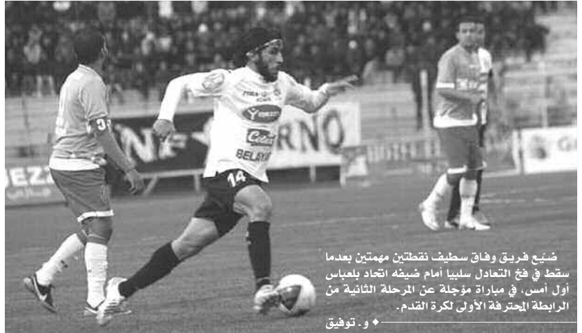
ضُيع فريق وفاق سطيف نقطتين مهمتين بعدما سقط في فخ التعادل سلبيا أمام ضيفه اتحاد بلعباس أول أمس، في مباراة مؤجلة عن المرحلة الثانية من الرابطة المحترفة الأولى لكرة القدم.