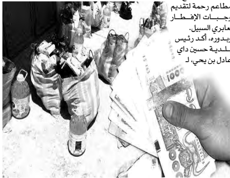
واجبات ساخنة لعابري السبيل.