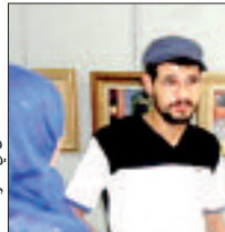
الفنان في معرضه