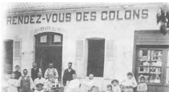
الظاهرة الاستيطانية في الجزائر

الضفة الجنوبية من نين حوض المتوسط" وقراءة في سياسة تهيمش وتفتيت المجتمعات المحلية (تقافيا، سياسيا اقتصاديا، اجتماعيا)، "ظاهرة الاستيطان في حضارات البحر المتوسط قديما"، "الاستيطان في العصور الوسطى" و"السلمون الفانتون في ضفتي المتوسط، وأفريقيا وجنوب الصحراء"، "الظاهرة الاستيطانية في الفترة الحديثة" وبن دور الوطني والشري وتصفية الاستيطان في الوطن العربي وقارة أفريقيا" وغيرها من المحاور.