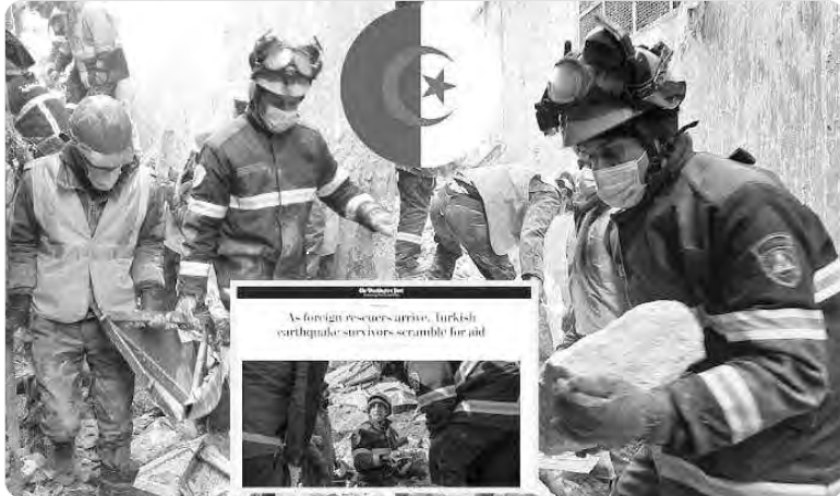
As foreign rescuers arrive, Turkish earthquake survivors scramble for aid

أشادت صحيفة "واشنطن بوست" الأمريكية بجهود الحماية المدنية الجزائرية التي تشارك في عمليات الإنقاذ إثر الزلزال الذي ضرب مناطق واسعة في تركيا وسوريا الاثنين الماضي، حيث وصف مراسلها من منطقة أديامان التركية أفراد الحماية المدنية بالأيصال في هذه المدينة بعدما نجحوا في إخراج طفلين من تحت حطام مبنى يقع في شارع تحول إلى أطلال. وأضافت الصحيفة أن إخراج فريق الإنقاذ الجزائري كان مميزا في الوقت الذي بدأ فيه اليأس يتسلل إلى النفوس من سماع أخبار جيدة تتعلق بتأجيل على قيد الحياة، مشيرة إلى أن عملية الإنقاذ تتعلق بطفلة تبلغ من العمر حوالي 7 سنوات وطفل أصغر منها تم تحويلهما إلى المستشفى، وأرفق التقرير الطويل بصور لعملية الإنقاذ التي نفذها فريق الحماية المدنية الجزائري، بالإضافة إلى صورة أخرى لمركز قيادة الفريق نفسه وهم في سياق مع الوقت لتنفيذ عمليات إنقاذ أخرى.