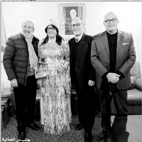
جانب من الضائية