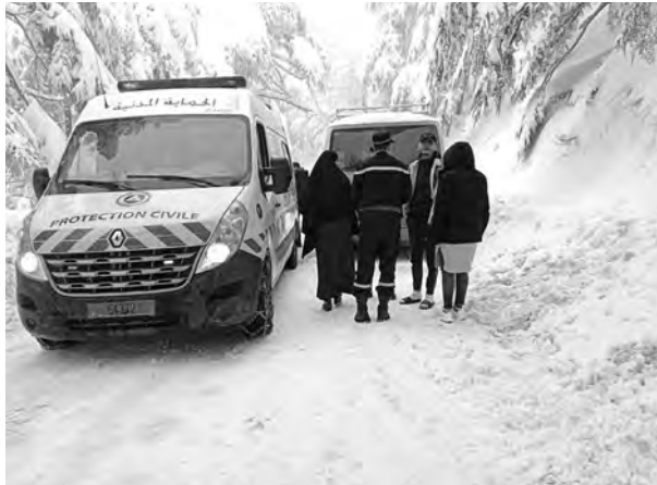
جهاز أمني بالطرق المؤدية إلى القمم الجبلية

شهدت أعالي منطقة الشريعة بالبيدة، منذ الأسبوع الماضي، بالترامع من قهظ التلوح، اجتماع كبيراً من طرف المواطنين، من أجل الاستماع بمناقشة بمناظرة الخلاية، بعيداً عن ضغوطات الحياة اليومية، ولحظت "المساء"، خلال مراقبتها لأحداث الحماية المدنية إلى المنطقة، الجوع الجاري، وجود الكثير من المركبات بولاحات ترقيق من مختلف الولايات، على غرار الجزائر العاصمة ويروج بوعوريج يومدراس وبجاية والمسيلة، وغيرها. قدم أصحابها خصيصاً إلى الشريعة لرؤية الرداء الأبيض، الذي تزينت به قمم ولاية البيدة.