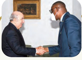
رئيس الجمهورية يستقبل وزيري الخارجية والمصالحة الماليين