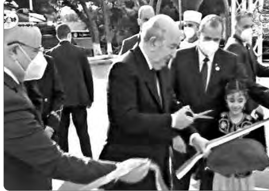
منجما الفوسفات والحديد من المشاريع الاستراتيجية للجزائر

من جهة أخرى، أكد رئيس الجمهورية عند وقوفه بجناح شركة مناجم الفوسفات، أن منجم الفوسفات بتبسة ومنجم الحديد لغار جبيلات بولاية تندوف، يمثلان مشروعين استراتيجيين بالنسبة لمستقبل الجزائر. وقال الرئيس تبون إن الجزائر ستستثمر في مادة الفوسفات الذي تعرفه السوق الدولية في هذا المجال، موضحاً أن هذا المشروع يعد معركة، وأنه "يبنى علينا رفع هذا التحدي، خاصة وأننا نملك الكفاءات والمؤهلات اللازمة لذلك". وأضاف أن الجزائر تسجل سنوياً تخرج نحو 250 ألف طن من مادة الفوسفات، ما يعني أنه لا يحق البقاء في نفس المستوى وإنما يتعين علينا التقدم نحو الأمام.