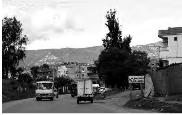
بحافلتين للنقل المدرسي، وتدعيم قريتهم بمتوسطة.

في سياق ذي صلة، فتحت مديرية النقل بسكيكدة خلال شهر مارس الماضي، باب الاستثمار في خطوط نقل المسافرين بمجموع 158 خط جديد، عبر 11 دائرة، بمجموع 32 بلدية، تتوزع بين خطوط ريفية أو ما يسمى بمناطق الظل؛ لفك العزلة عن السكان، وبلدية، وأخرى وطنية، منها 87 خطا مخصصة لمناطق الظل، إلى جانب فتح 7 خطوط وطنية بين بلدية المرسى وعنابة،