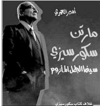
غلاف كتاب سكورسيزي

وإلى جانب اهتمامه، يعد سكورسيزي أحد أكبر السينمائيين الأمريكيين اهتماما بالسينما الأوروبية الحديثة، وبالحوارات السينمائية التي غيرت وجه السينما في العالم، مثل الواقعية الجديدة الإيطالية، والوجه الجديدة الفرنسية.