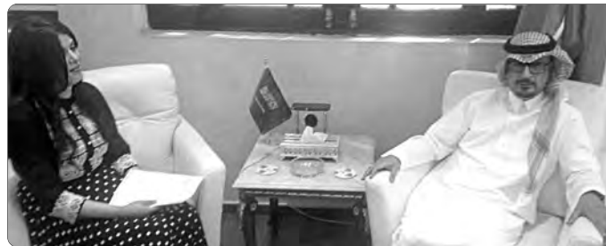
السفير السعودي رفقة صحفية "المساء"

أكد سفير المملكة العربية السعودية في الجزائر، عبد الله بن ناصر البصري، أن الجزائر تعرف انفتاحا كبيرا، في مجال الاستثمارات، ولا سيما باتجاه الدول العربية الشقيقة، حيث يعمل رئيس الجمهورية، السيد عبد المجيد تبون، على عقد شراكات استراتيجية مع أشقائه العرب، ويحرص على إزالة المعوقات والحواسر التي كانت تقف أمام الاستثمار الأجنبي لدخول السوق الجزائرية، معربا عن الالتزام الدائم للمملكة لمرافقة الجزائر في كل المساعي والمشاريع الرامية إلى تحقيق ازدهارها ورقبيتها.