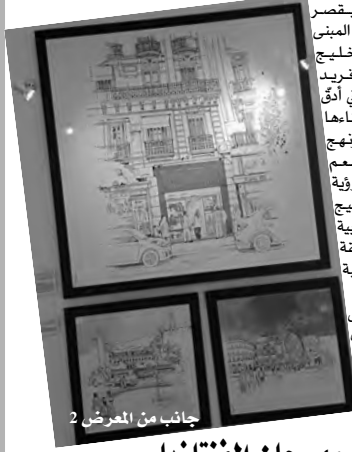
جانب من المعرض 2

في الختام، طلب فريد بن ياع العمل بروح متفائلة والتوقف عن الشكوى، وكذا التحرك وإعطاء الأمل للشباب تحت شعار كل شيء ممكن.