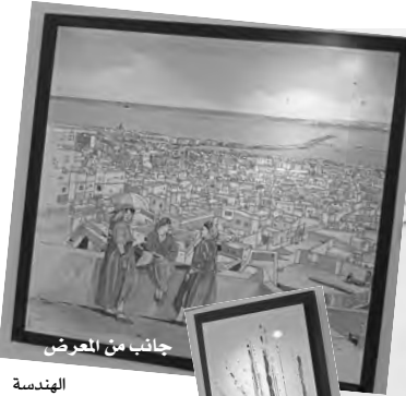
جانب من المعرض

الهندسة المعمارية في قطاع الدولة والقطاع الخاص. كما أراد من خلال هذا العمل الضخم، التوفيق بين الفن والعمارة التي هجرت بيتنا.