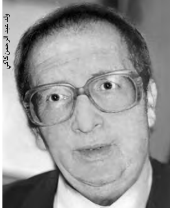
عبد القادر علولة