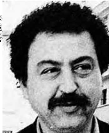
عبد القادر علولة

(بوتوميم) الذي برز فيه المسرحيان هواوي بورا ولفاضل سيدي محمد، حيث طور هذا الأخير عروضاً "الشو الهزلي والأغنية الفكاهية" بأسلوبه الخاص، بالإضافة إلى ظهور مسرح الشارع الذي يعيد مجد الحلقة، من خلال تجريري "الفاجي" و"أزمة عمل في كورنا" اللذين يؤسسان لعهد جديد، فوامة مسرح المدينة، بالإضافة إلى مساهمة فرقة "دول ماديير" في نشر فن الارتجال. وأهم ما يميز المشهد المسرحي بوهران، أن العروض لم تتوقف خلال ألعاب البحر الأبيض المتوسط التي استحضرتها بوهران إلى غاية 6 جويلية القادم، سيكون ضيوف الجزائر على موعد مع تظاهرات للفن الرابع، من شأنها الإسهام في صنع الفرجة وإضفاء أجواء ثقافية، حيث ينظم المسرح الجهوي "عبد القادر" علولة الأيام الوطنية لمسرح الشارع من أجل تشييط مدينة بوهران خلال الحدث الرياضي.