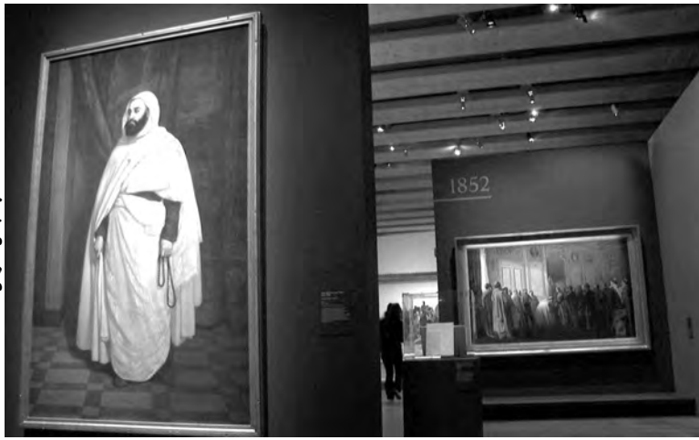
جانب من العرض

عبد القادر، من صنف ونقوش وكتب وصور ورسائل، أعطاها لمتحف مرسيليا.