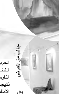
لوحة أخرى تتجلى ثقافة الشرق من خلال "ألفاليلة" وليلة.