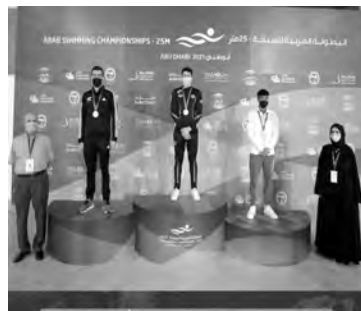
وحيث يطمح الثنائي صيود وعرجون لتحسين الحد الأدنى الذي يمتلكانه.