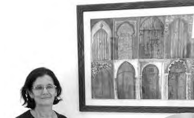
الفنانة في معرضها