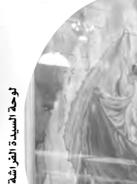
لوحة السيدة الفراشة

وفي لوحة أخرى تتجلى ثقافة الشرق من خلال "ألفاليلة" وليلة". وتبدو شهزاد حاملة، تملك كل البلاط بفستانها الحريري المزركش، وبزخرفة القصر اللآلئ، ويمنظر العمارة الإسلامية البامبي من الشرفة تحت ضوء القمر. وتطل في لوحة مجاورة، امرأة أخرى هي "السيدة الفراشة كرمز لأصل