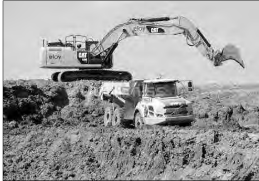
الجرافة والشاحنة في المحشر البلدي. الحسن حامة

يحترفان سرقة المنازل ببجاية، بعد تسجيل اتصال هاتفي على الرقم الأخضر للأمن الوطني، بخصوص وقوع سرقة بأحد المساكن في المكان المسمى تاركة أوزمور بمدينة بجاية، حيث تقلت عناصر الشرطة إلى مكان وقوع الجريمة، وبعد المعاينة الميدانية، تبين بأن الفاعل بعدما قام بفتح باب المدخل بالقوة باستعمال قلع مسامير ودخوله المنزل دق جرس الإنذار، وقد لاذ بالفرار نحو وجهة مجهولة تاركا مقلع المسامير في المكان. بعد عمليات بحث وتحرر واسعة وبالإعتماد على الوسائل التقنية، تم تحديد هوية الفاعل وتوقيفه رفقة شريكه الذي كان يجرس المكان، ويتواصل معه هاتفيا، وتم إنجاز ملف جزائي ضد المشتبه فيهما أمام وكيل الجمهورية لدى محكمة بجاية. وبعد جلسة المثول الفوري، صدر ضد الأول عام الرقابة القضائية.