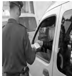
مع ذلك، تم تنظيم 31 خروجة ميدانية للتوعية والتحفيز من أخطار الحوادث المرورية.