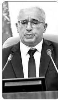
الانخراط في برنامج الرئيس واجب ..

القاعدة الأساسية لتحقيق الديمقراطية التشاركية التي تعتبر أبرز ركائز الحكم الرشيد. قرار قطع العلاقات مع المغرب مؤسس على حقائق لا تقبل الشك ولدى تطرقه لشأن الإقليمي الدولي أثنى بوغالي، على الحصانة التي اكتسبها الشعب الجزائري بتبنيته بالقيم الوطنية، "ما جعله يفتقر الفرصة على أعداء الوطن، ويجهض مخططاتهم العدوانية المستهدفة لأمن واستقرار الجزائر"، كما أشاد بالتلاحم والتضامن التي أظهرهما الشعب الجزائري، خلال أزمة الحرائق الإجرامية التي مست مناطق من الوطن مؤخرا، مشيرا إلى أن "الشعب خرج من هذه المحنة منتصرا موحدا، على عكس ما تعناه الحاقدين والمتآمرين". ونوّه أيضا في ذات السياق بالمبادرات التي قام بها أفراد الجالية الجزائرية بالخارج، والتي أكدت تعلق هذه الأخيرة بالوطن.