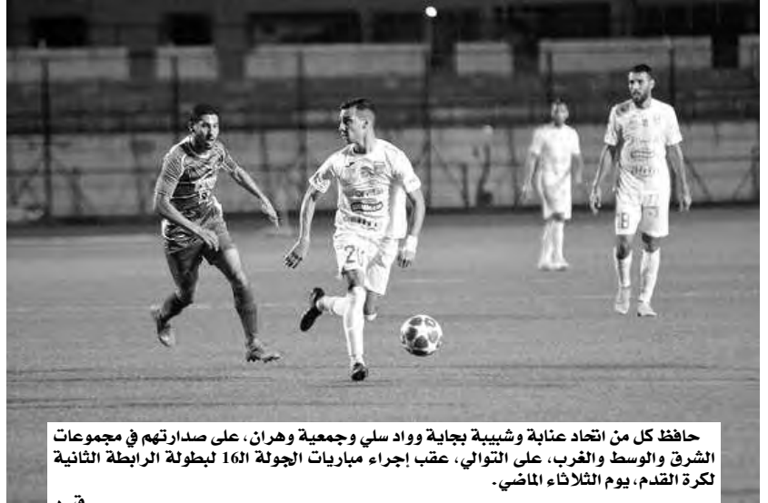
حافظ كل من اتحاد عنابة وشبيبة بجاية وواد سلي وجمعية وهران، على صدارتهم في مجموعات الشرق والوسط والغرب، على التوالي، عقب إجراء مباريات الجولة 16 لبطولة الرابطة الثانية لكرة القدم، يوم الثلاثاء الماضي.

في الغرب، تبقى الأمور على حالها، حيث عاد مستقبل واد سلي بفوز ثمين من شباب واد أرهيو (0-1)، كما فازت جمعية وهران على جيل عين الدفلى (0-2)، في حين انهزم شباب عين تموشنت في ملعب شبيبة تيارت (0-1). وبهذا، تتواصل الريادة المشتركة بين فريق واد سلي والجمعية الوهرانية برصيد 37 نقطة لكل منهما.