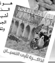
الذاكرة تأبى النسيان