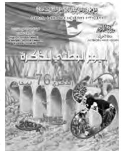
الذاكرة تأبى النسيان

تم، أمس السبت، توزيع 50 سكناً وظيفياً لفائدة أساتذة قطاع التعليم العالي والبحث العلمي، بولاية تلمسان، ضمن إحياء اليوم الوطني للذاكرة. وبذات المناسبة التاريخية، تم أيضاً توزيع ثمانية سكرات مجهزة لفائدة أطباء أخصائيين بالمنطقة، خلال حفل بدار الثقافة بعاصمة الولاية. وشهدت الولاية تنظيم عديد التظاهرات التاريخية والثقافية تخليداً لليوم الوطني للذاكرة المصادف لذكرى مجازر 8 ماي 1945، حيث تم الترحم على أرواح الشهداء الطاهرة بمقبرة الشهداء، وإقامة معارض تاريخية بدار الثقافة وعرض شريط وثائقي حول المذابح الوحشية للمستعمر، والقاء محاضرات من قبل أساتذة جامعيين في التاريخ.