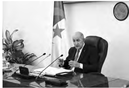
الاستقرار وبث الفرقة.

دعا رئيس الجمهورية، السيد عبد المجيد تبون، أول أمس، الشعب الجزائري إلى التعبير بكامل الحرية، وباسمى الطرق الحضارية في اختيار ممثليه خلال الاستحقاقات السياسية المقررة في 12 جوان القادم، فيما دعا بمناسبة إحياء الجزائر لذكرى يوم العلم، الشباب الجزائري، من تلاميذ وطلبة في المدارس والجامعات ومراكز التكوين إلى شق طريقهم نحو التآلق والنجاح بالاجتهاد والعلم ومكارم الأخلاق ..