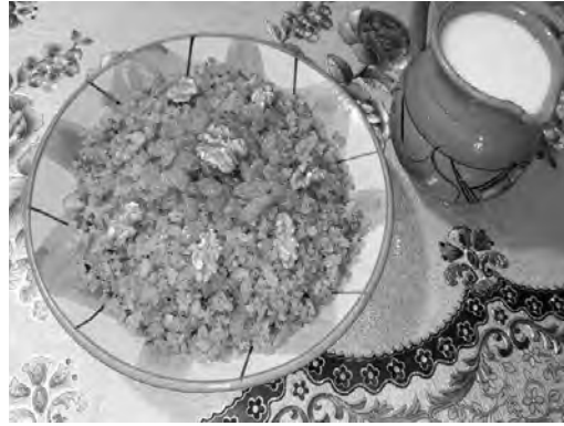
"الرفيس" و"الزيراي" وخبز الدار...

وبعيداً عن أجواء التحضيرات لاستقبال شهر الرحمة في هذا الطرف المميز، أكد العديد ممن تحدثت إليهم "المساء"، أن ثمة من الإجراءات الواجب تطبيقها بخصوص الحيلة والحذر من فيروس "كوفيد 19"، وحسبهم، قلن يكون ذلك بالسهل للشذوذ عن القاعدة والتخلي عن بعض المظاهر التي تميز الشهر الفضيل عن بقية الشهور: كتبادل الزيارات، والإقبال على المقاهي والمساجد لأداء التراويح: خلافاً للسنة الماضية بسبب الطرف القاهر الذي فرضته جائحة الكورونا، وعلى المنزهات والحدائق العمومية للترفيه عن النفس، والتي تشكل وجهة العائلات للمهرج: ففهم من يقصدون حديقة قادري بفسديس وحديقة جرمة، ومنتهز "حملة القديمة" ومنتهز تازولت "لامبيز".