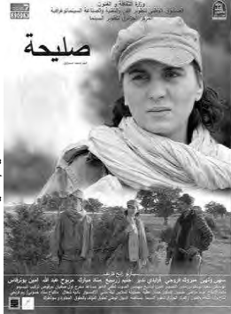
مسابقة فيلم صليحة