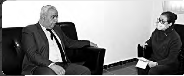
حوار: حنان حيمر. تصوير: ياسين أكسوس

كشف المدير العام لتجمع النقد الآلي، مجيد مسعودان، في حديث "المساء" عن وضع خلال أسبوعين، منصة تختص بتصرف التجار الراغبين في اعتماد البيع عبر الانترنت، ضمن خطوة للقضاء على البيروقراطية التي كانت تميز العملية، بعد البدء في عمليات الدفع عبر الهاتف النقال على مستوى البريد وبعض البنوك، في انتظار توسيعها مستقبلاً ولكن لتشمل فقط أصحاب الحسابات البريدية والبنكية.