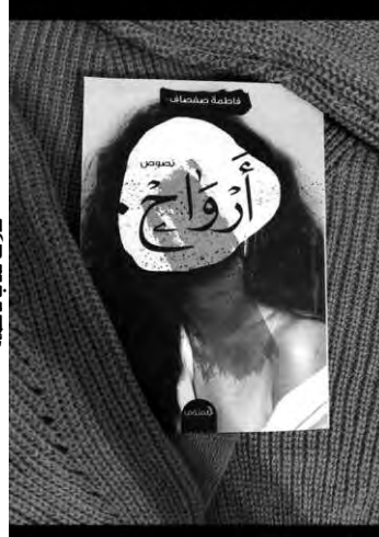
غلاف كتاب فاطمة