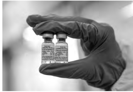
جرعات لقاح سبوتنيك الروسي المضاد لفيرس كورونا سيصل

وقد برلماني بجانت متابعة الحركة السياحية بالمنطقة