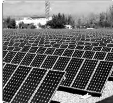
هذا القطاع مع إعطاء قيمة مضافة كبيرة خلال مرحلتي الدراسة الطاقوية والطاقات المتجددة مختلف أنواع المشاريع التي يمكن الإنجاز.

أكد الوزير المنتدب لدى الوزير الأول المكلف بالمؤسسات الصغيرة، نسيم ضيافات، أمس، على ضرورة إشراك المؤسسات الصغيرة والناشئة في مختلف مشاريع تطوير الطاقات المتجددة والنجاعة الطاقوية في الجزائر، لاسيما من خلال إزالة العقبات البيروقراطية.