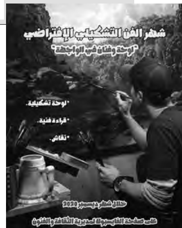
شمالی مشرقی ایشیاء 2020

أوضح المتحدث لـ "المساء"، أن التظاهرة تمتد لشهر أما من بداية ديسمبر إلى نهايته، على صفحة مواقع تواصل الاجتماعي "الفيسبوك" لمديرية الثقافة الفنون بأم البواقي، حيث يتم تقديم لوحة تشكيلية لفنان من الفنانين مرفقة بفترة نقابة فنية ونقدية لها، مع فتح