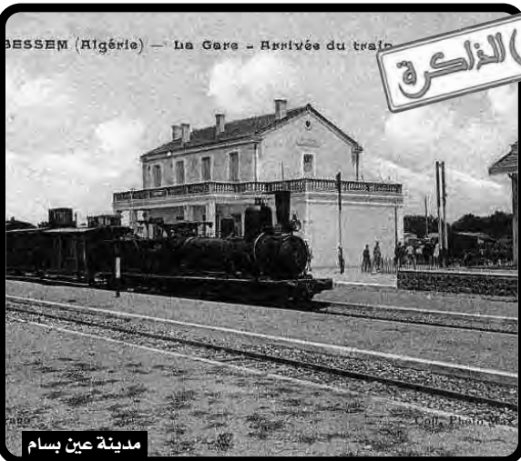
مدينة عين بسام