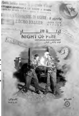
مسابقة فيلم "ليلة النار"

الإعلام الدولية والجامعة الكندية، له العديد من الكتب، سبق أن عمل كرئيس المركز القومي للسينما ورئيس مهرجان الإسكندرية، كتب للسينما 20 فيلما طويلا و3 أفلام قصيرة، نالت منها العديد من الجوائز.