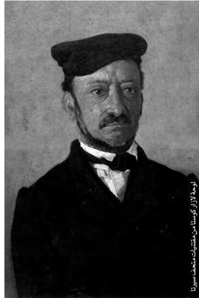
لوحة لازار كوستا من مقتنيات متحف سيرتا

توفي هذا العالم الإيطالي في شهر أبريل 1877م، وكان يحق خبيرا كبيرا بمدينة قسنطينة وضواحيها، وكان أيضا باحثا لا يكل ولا يمل، مقتنعا بأن التحف القديمة التي تم استخراجها من إفريقيا، لا بد أن تبقى في موطنها الأصلي.