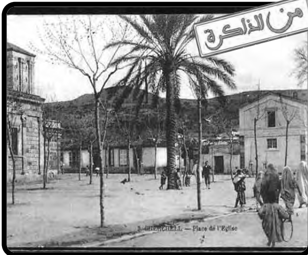
مدينة شرف شلال