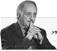
بقلم: محيي الدين عويصر