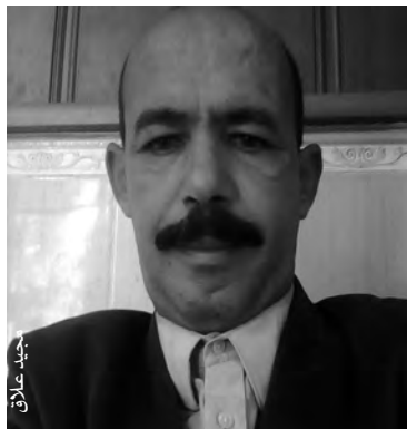
عضو اتحاد الكتاب الجزائريين

في إطار آخر، سبق لفرع اتحاد الكتاب الجزائريين أن نظم ملتقين، الأول كان في أكتوبر 2018، حول الشعر الثوري، شارك فيه شعراء من 25 ولاية، إضافة إلى شعراء من تونس. أما الملتقى الثاني، فقد تم تنظيمه، حسب رئيس الفرع، في شكل توأمة بين فرعي أم البواقي واتحاد الكتاب الفلسطينيين بالجزائر، برأيه الدكتور أبو النجاة، وتم بهذه المناسبة، تنظيم معرض شاركت فيه دارا نشر فلسطينيتين، وهما دار ابن الشاطئ التي يديرها الطبيب الجزائري من أصول فلسطينية، عدي الشتات وهو زوج الشاعرة الجزائرية حسناء بروش، ودار "كنعان" التابعة إلى فرع اتحاد الكتاب الفلسطينيين بالجزائر، إضافة إلى تقديم قراءات شعرية.