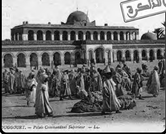
DUGGOURT. — Palais Commandant Supérieur