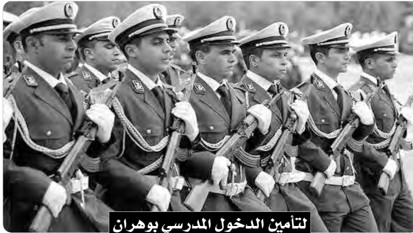
لتأمين الدخول المدرسي بوهران