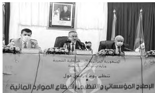
تنظيم يوم دراسي حول الإصلاح المؤسساتي والنظري لقطاع الموارد المائية

أكد وزير الموارد المائية، أرزقي براقبي، أن إعادة النظر في تسعيرة المياه غير مطروحة حاليا على طاولة عمل دائرته الوزارية التي حددت أهدافا أساسية، ضمن استراتيجيتها الرامية إلى تحسين الخدمة العمومية والحفاظ على هذه المادة الحيوية والبحث عن أنجع السبل لترشيد النفقات العمومية وتخفيف من الأعباء الإدارية.