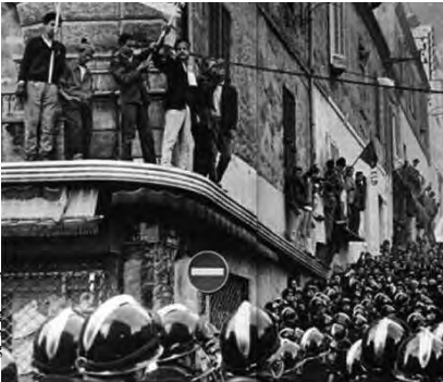
مشاركة مؤسسة زغود يوسف

سقطت مؤسسة "الشهيد العقيد زغود يوسف" التاريخية، برنامجا علميا واحتفاليا ضخما، بمناسبة اليوم الوطني للهجرة، المصادف ليوم 17 أكتوبر 1961، بهدف إلى ترسيخ هذه اللحظة في ذاكرة الشباب، من خلال معارض كتب ومصور وندوات وأفلام تسجيلية وغيرها، مع قراءة لمسرحية "ألمسية باريس" التي تناولت الذكرى.