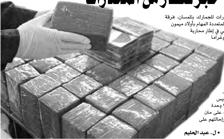
• ل. عبد الحليم

تمكنت كل من الفرقة الجهوية لمكافحة المخدرات للجمارك بتملسان، فرقة الجمارك بالعريشة وفرقة الجمارك بسبدو والفرقة المتعددة المهام بأولاد ميمون بالتعاون والتنسيق مع مفرزة من الجيش الشعبي الوطني في إطار محاربة الجريمة المنظمة العابرة للحدود، من حجز 102 كيلوغراما من المخدرات في عمليتين متفرقتين، الأولى تمت على إثر كمين أقيم بضواحي مدينة العريشة ولاية تلمسان، تم فيها استرجاع 98 كيلوغراما من الكيف المعالج، كانت على متن شاحنة، والثانية تمت إثر كمين أقيم بضواحي ولاية سيدي بلعباس، أسفر عن حجز 4 كيلوغرامات من الكيف المعالج، في ذات السياق، وعلى إثر دورية أقيمت لمراقبة الطريق الوطني رقم 95 الرابط بين بن باديس وسيدي بلعباس، استعادت عناصر الفرقة المتعددة المهام لابن باديس التابعة لمفتشية أقسام الجمارك بسيدي بلعباس وحدة من المشروبات الكحولية من مختلف الأنواع، كانت على متن سيارة من نوع سبكترون، وقد تم توقيف المخالفين وإحالتهم على الجهات القضائية المختصة.