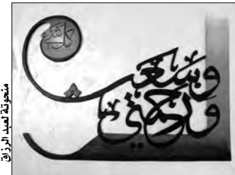
منحوتة لـ بوزيد عبد الرزاق

أما عن منحواته الجديدة التي أنجزها في الفترة الأخيرة، فقد نحت أول منحوتة له على الخشب بالخط العربي؛ حيث رواه هذه الفكرة منذ تنظيمه صالون فن الخط، وهكذا نحت مقولة (الزم العزلة تتج). منحوتة ثانية (ورحمتي وسعت كل شيء)، وثالثة (لا يفتني حذر من قدر)، والهم اغفر لي ولوالدي، ومنحوتة (مكتوب فيها أمي) هي هدية لأمه في عيد ميلادها، إضافة إلى منحوتات لم يكملها بسبب نوعية الخشب غير الملائمة، مثل منحوتة (استقم كما أمرت).