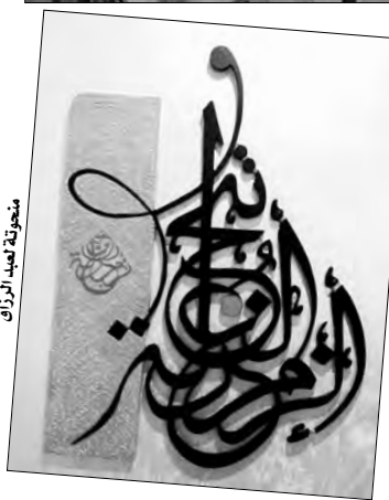
منحوتة لـ بوزيد عبد الرزاق