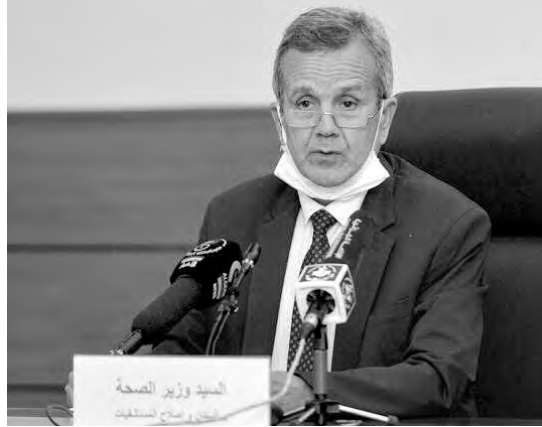
السيد وزير الصحة أحمد بن بوزيد

شدد وزير الصحة والسكان وإصلاح المستشفيات، عبد الرحمان بن بوزيد، على ضرورة استغلال فرصة استقرار الوضعية الوبائية الناجمة عن تفشي كوفيد-19 بالجزائر، لتعزيز قدراتنا المادية والبشرية ومخزوننا من الكمادات وكل وسائل الوقاية، تحسبا لأي موجة أخرى، معتبرا أن "النتائج التي تم تحقيقها في مواجهة الجائحة مرضية خاصة وأفنا انتصرنا في معركة من حرب على عدو احتل كل العالم".