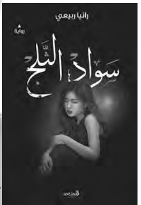
غلاف رواية سواد الثلج

كما سلطت رائية الضوء من خلال إصدارها هذا، على العلاقة العائلية التي تربط الإنسان بماضيه، بما أنه لا يتمكن من التجرد منه كلياً، ولا من العودة إليه لميشه مرة أخرى، مشيرة إلى أن عنوان الرواية "سواد الثلج" منير للاهتمام واستثنائي، لكنها تراه حقيقة أكثر، ويحكي بصدق عمق تناقضاتها.