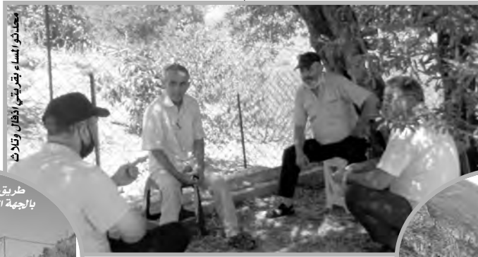
مجلس لائحة بقرية أذفال وتلات