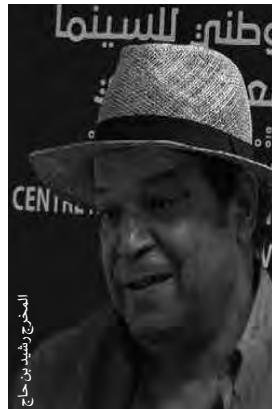
المخرج رشيد بن قن

أعلن مهرجان مالمو للسينما العربية بالسويد، حديثاً، عن عرض الفيلم الجزائري "مطاريس" آخر الأفلام الروائية للمخرج رشيد بن قن. في ختام الدورة العاشرة لهذا الحدث السينمائي العربي الأهم في أوروبا، المزمع تنظيمه في الفترة الممتدة من 8 إلى 13 أكتوبر الداخل، وفقاً ورد في بيان صحفي تلقت "المساء" نسخة منه.