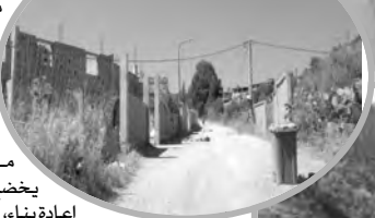
طريق مهترنة نحو القرى بالجهة الشرقية لبلدية عمّال

مباشرة أعمال التهيئة حتى يعود للسكن بالقرية الفلاحية، تماما مثل رابع رحاي الذي أدخلنا إلى منزله الذي كان يخضع حينها لأشغال