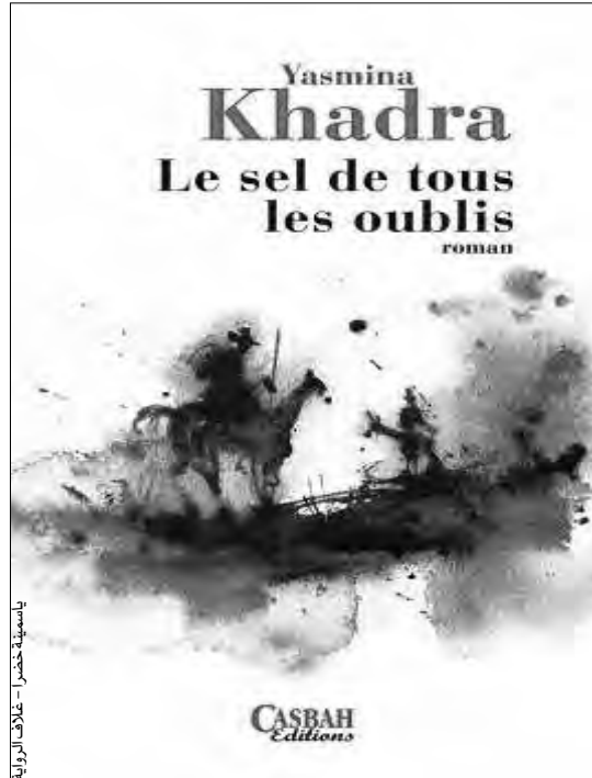
ياسمينه خضرا - غلاف الرواية

بعد تحرره من قهر المستعمر، وهكذا يلتقي بالشابة هذه، أثناء إقامته في مزرعة زوجها المعوق وتستيقظ داخله شياطينه القديمة. يرى بعض النقاد والقراء أن هذه الرواية ذات حبكة سوسولوجية، وتكتشف تدريجياً بأحداثها الغزيرة وتناجها، أو في الأفكار والتأملات الحميمة لشخصياتها الغنية بالألوان.