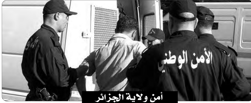
أمن ولاية الجزائر