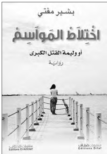
بشير مفتي اختلاط المواسم أو وليمة القتل الكبرى رواية